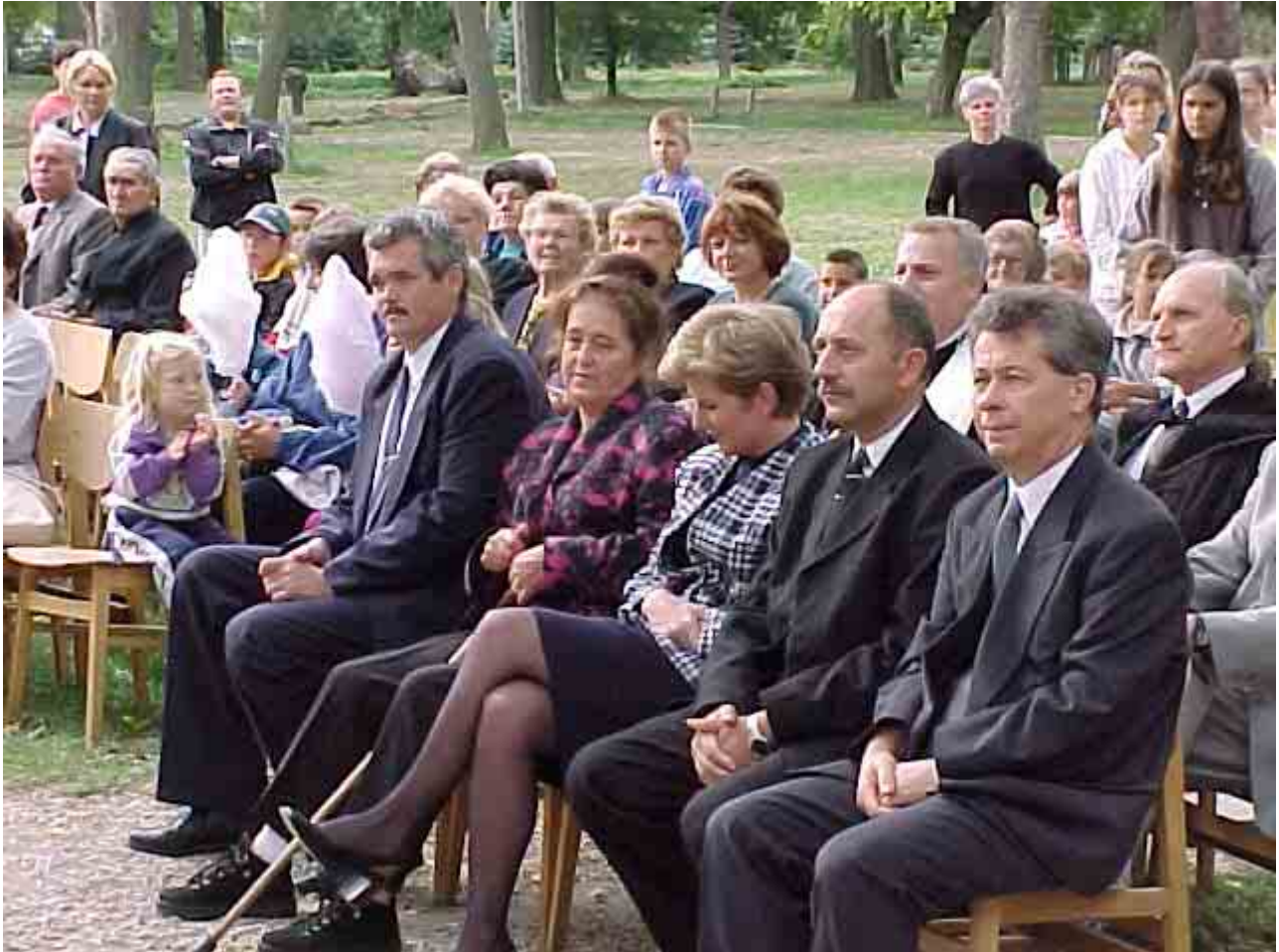
A hantosi millenniumi zászlóátadás ünnepségén 2000-ben

szép ebben a szakmában, hogy nincs két egyforma diák. És ha visszagondolok a pályafutásomra, én nem azért emlékszem a diákjaimra, mert jók voltak, hanem valamiért kötődtem hozzájuk. Ideális tanár még inkább nincsen. Akiket én mint tanárt szerettem, olyanok voltak, akiknek a személyisége részben beépült az enyémbé. Emberileg tanultam tőlük valamit. Nemcsak tárgyi tudást, hanem viselkedésmódot. És mert nem voltak egyformák, mindegyikből más maradt meg bennem. Utólag jön rá az ember, hogy mennyi minden épült be az életébe, amit az iskolában kapott. Nem kell hosszú idő, pár év, és ti is meg tudjátok fogalmazni magatoknak, hogy kit szerettetek és miért. Mindenki más, és ez a jó.