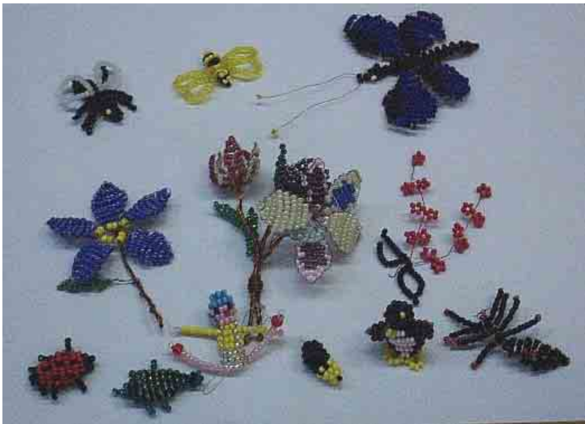
Válogatás az „Ügyes kezek” szakkör gyöngyfűzős munkáiból

Selymit a barka már kitakarta, sárga virágját bontja a som. Fut, fut az áram a déli sugárban, s hőkken a hó a hideg havason.