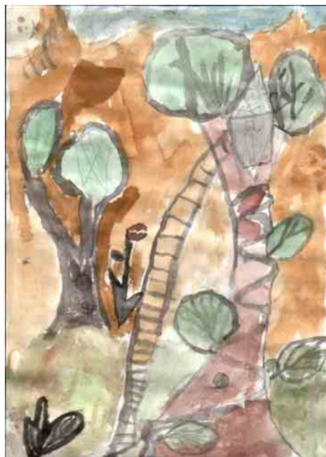
Újfalusi Márk 1. o.

A megfejtéseket a következő számban közöljük.