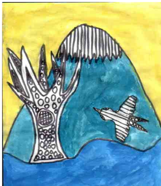
Ménesi Róbert 3. o.